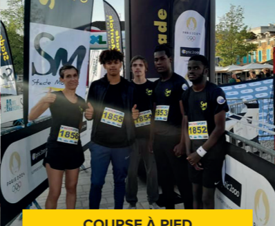
COURSE À PIED