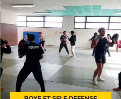
BOXE ET SELF DEFENSE