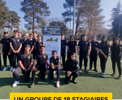
UN GROUPE DE 18 STAGIAIRES