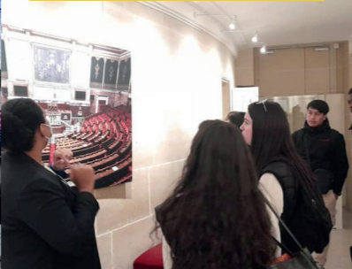
VISITE DU QUÉBEC