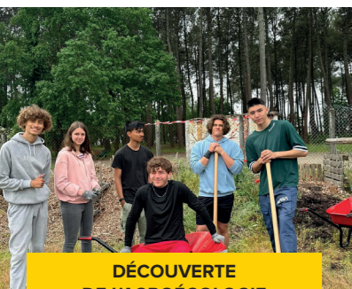
DÉCOUVERTE DE L'AGROÉCOLOGIE PAR LE JARDINAGE