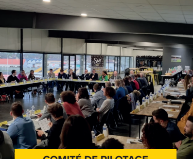
COMITÉ DE PILOTAGE