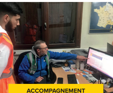
ACCOMPAGNEMENT DU MENTOR