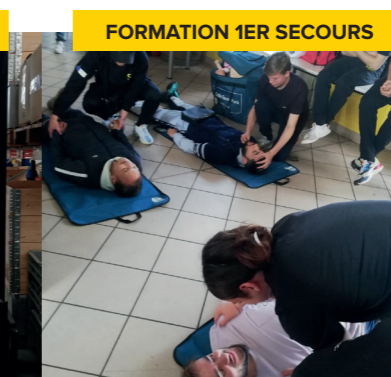
FORMATION 1ER SECOURS