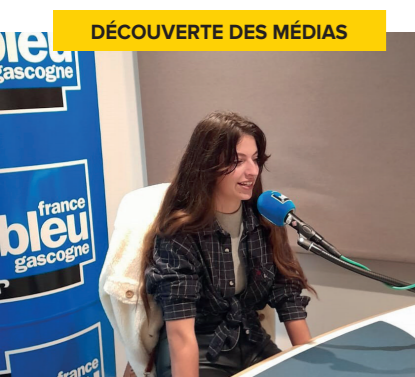
DÉCOUVERTE DES MÉDIAS