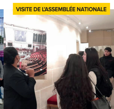
VISITE DE L'ASSEMBLÉE NATIONALE