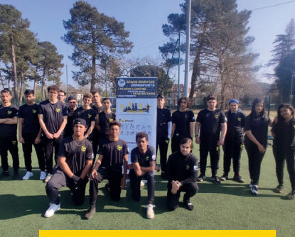
UN GROUPE DE 18 STAGIAIRES