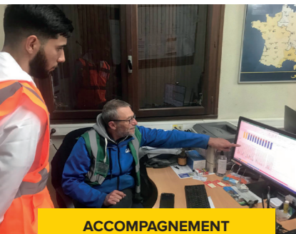
ACCOMPAGNEMENT DU MENTOR