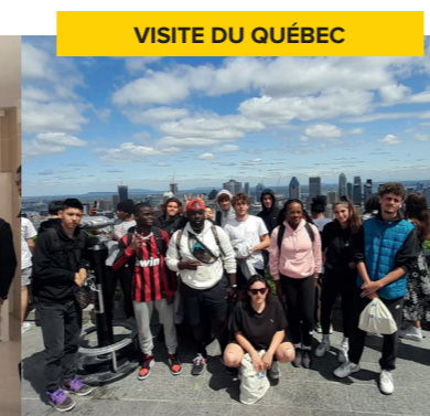
VISITE DU QUÉBEC