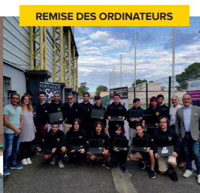
REMISE DES ORDINATEURS