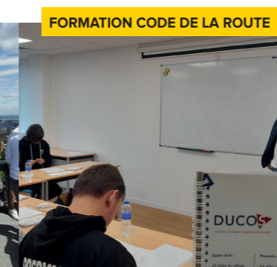
FORMATION CODE DE LA ROUTE