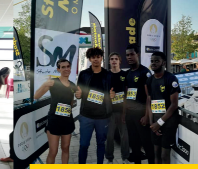
COURSE À PIED