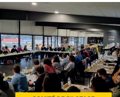
COMITÉ DE PILOTAGE