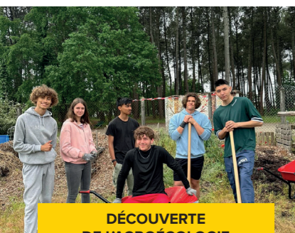
DÉCOUVERTE DE L'AGROÉCOLOGIE PAR LE JARDINAGE