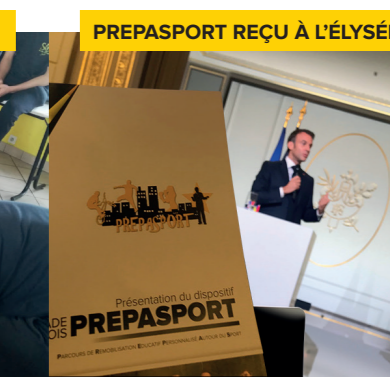
PREPASPORT REÇU À L'ÉLYSÉE