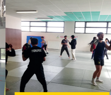
BOXE ET SELF DEFENSE