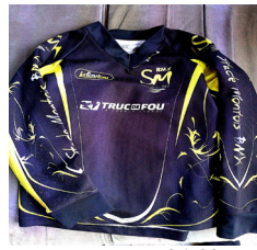
Le maillot de la renaissance