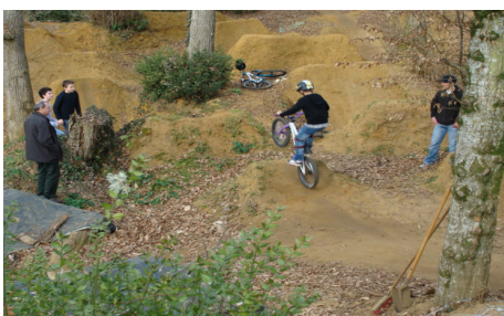
« le champs de bosse derrière le hall»

La mairie étant incapable de faire une pseudo piste à Pémégnan, laisse à loisirs le spot de Nahuques. La pratique du bmx est de plus en plus délaissée pour le dirt. Toutefois ce «champ de bosses» va permettre au club de rebondir sans chercher à faire des compétitions: